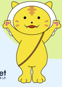
加美町公認キャラクター かみてく